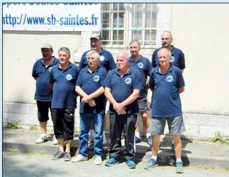
A. B. A. Champions régionaux des A.S. 3 & 4 ème Div.